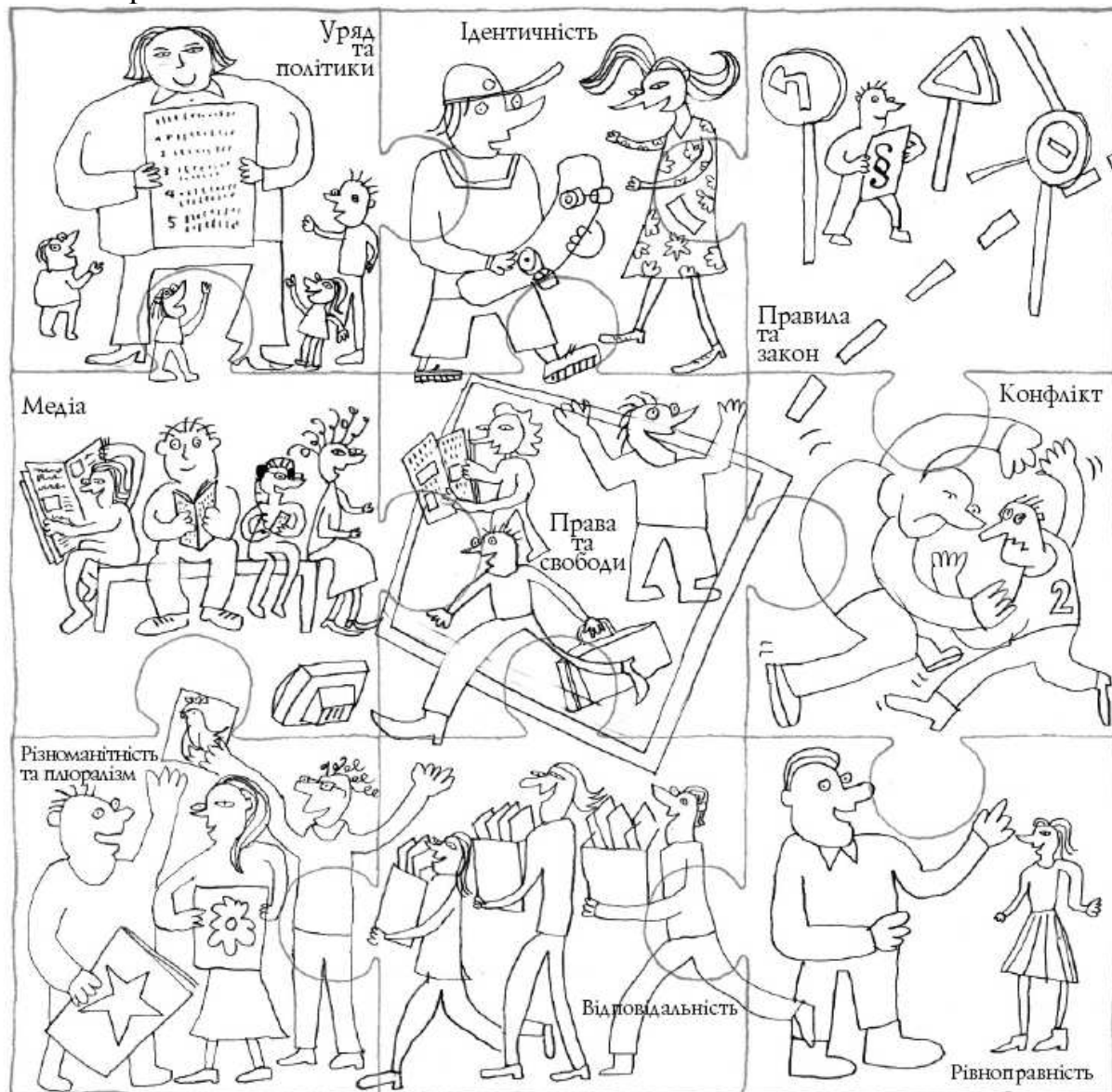
Рис. 1. Пазл-ілюстрація до серії посібників Ради Європи з питань освіти для демократичного громадянства (П. Віксман 30 )

Рівноправність і свобода. Ці два ключові поняття розглядають разом. На думку експертів РЄ, свобода та рівність формують діалектичну єдність протилежностей 29 . Перша не може розглядатись без другої, але водночас ці поняття є різними.