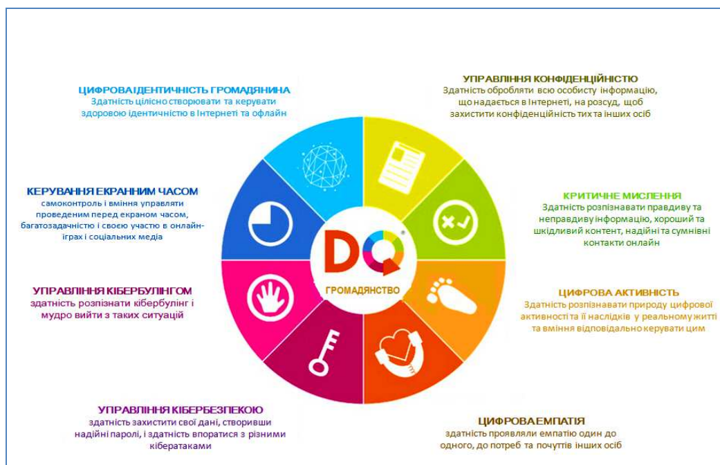
Рис. 2 Складники цифрового громадянства 38

Привернення уваги до цифрового інтелекту сучасної людини, вчителя зокрема, пояснюється тим фактом, що для основного покоління сучасних вчителів ІКТ та цифрові медіа були не досить розвиненими сферами у професійній діяльності. Натомість сьогодні ці питання є важливими та обов'язковими для досягнення успіху у всіх сферах життєдіяльності людини. Саме сьогодні цифрові навички та цифрова компетентність стали невід'ємною частиною цілісної системи освіти. Цифрова компетентність увійшла як ключова до основних стратегічних рекомендацій та стандартів розвинених країн світу, стала предметом уваги освітніх політик багатьох країн.